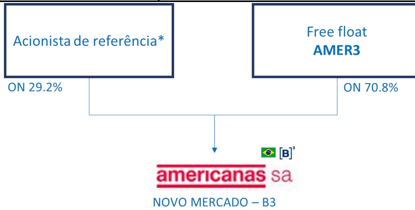
Figura 2: Estrutura de acionistas pós-acordo