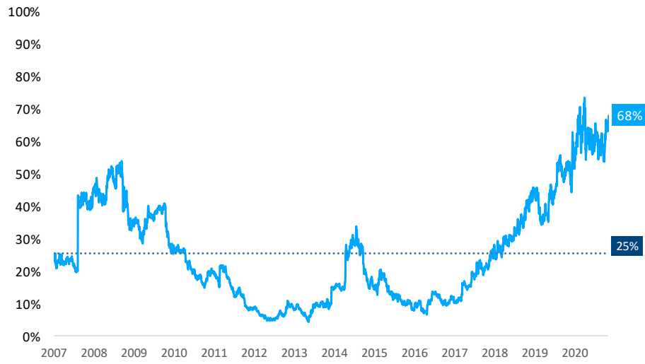
Tabela 3: Participação histórica da B2W no valor patrimonial de LAME