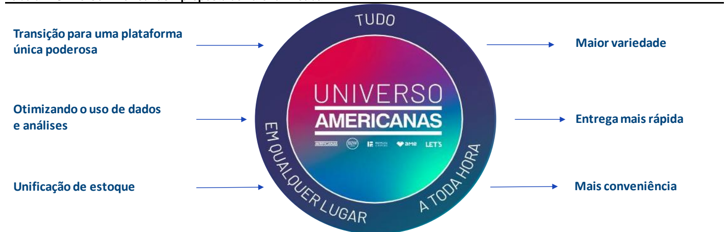
Tabela 2: Universo Americanas – proposta de valor unificada